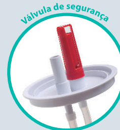
Válvula de segurança