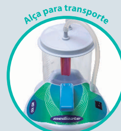
Alça para transporte