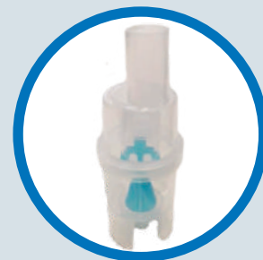
Copo nebulizador Turbo