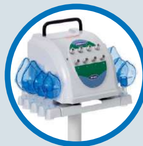
Suporte para 8 copos de nebulização